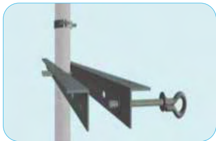
Unidades de medida mm.

En la siguiente tabla se presenta las características físicas de los "Pernos de ojo".